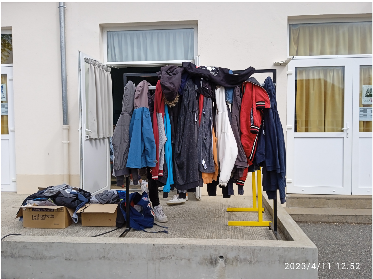
Quelques oubliés du collège, photo de Marina, 3ème Corail

Interview réalisée par Marina, 3ème Corail